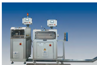
Отрезная / машина / ленторез Измерительная система